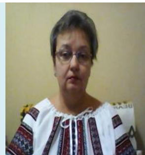
Старший викладач кафедри лінгводидактики та іноземних мов