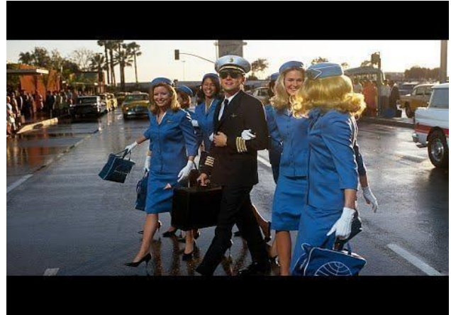
Набір у Pan Am.

Цей механізм пояснюється психологічним феноменом авторитету, дослідженим Стенлі Мілгремом, який довів, що люди схильні підкорятися особам, які мають ознаки влади або професійного статусу.