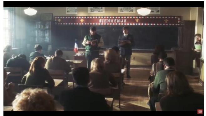
Вчитель на заміні.

У соціальній інженерії цей принцип активно використовується під час телефонного шахрайства, фішингових атак або фальшивих службових звернень.